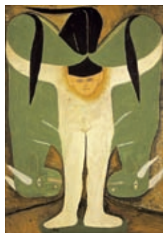
Sava Sekulic: Der Mann überwältigt die Ochsen, Mischtechnik/Pappe, 102 x 71 cm